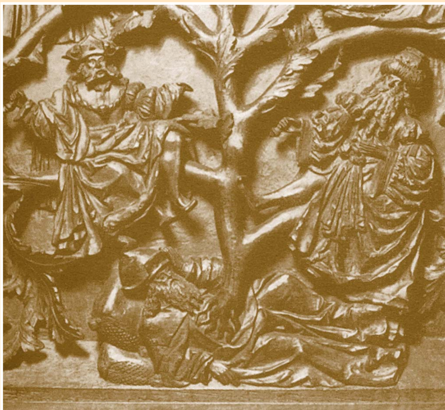
Sacrestia minore-vestibolo, altare ligneo, XVI secolo, particolare con "L'albero di Jesse"

Attenzione. In caso di mancato recapito, rinviare all'Ufficio di Torino C.M.P. Nord per la restituzione al mittente, Rettore del Santuario della Consolata - Via Maria Adelaide, 2 - 10122 Torino, che s'impegna a corrispondere la relativa tariffa.