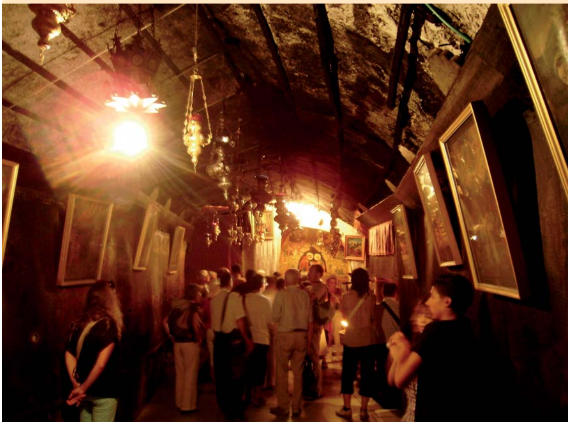
Betlemme - Il luogo della nascita di Gesù

Attenzione. In caso di mancato recapito, rinviare all'Ufficio di Torino C.M.P. Nord per la restituzione al mittente, Rettore del Santuario della Consolata - Via Maria Adelaide, 2 - 10122 Torino, che s'impegna a corrispondere la relativa tariffa.